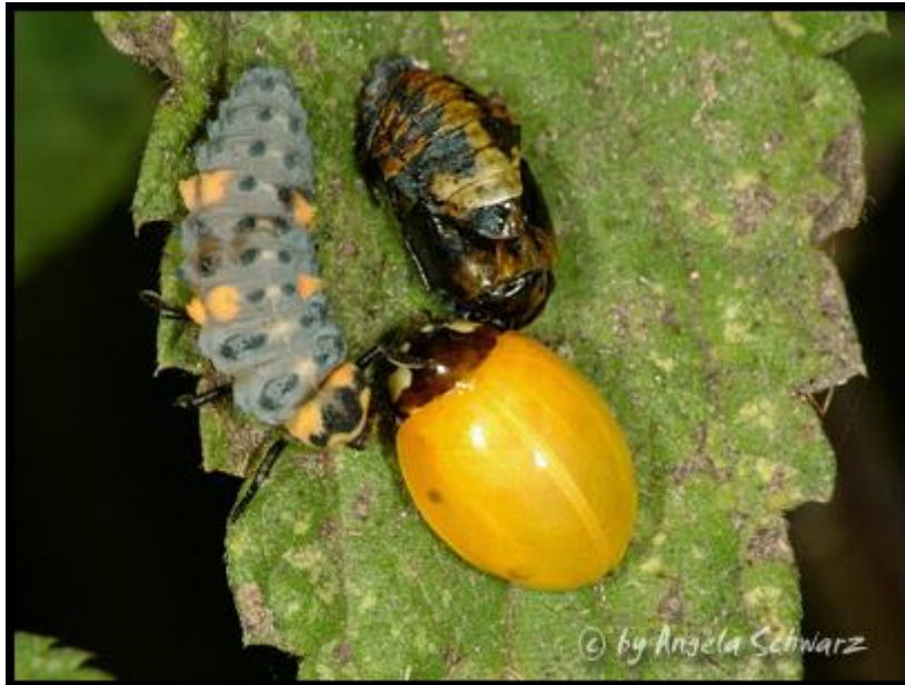
Abb. 2 Marienkäfer Larve, Puppe und frisch geschlüpfter Marienkäfer

Anton fand bald Anita eine wunderschöne Marienkäfer Frau. Die beiden wurden unzertrennlich, flogen immer zusammen von Blatt zu Blatt und suchten sich die fetttesten Blattläuse. Als diese alle aufgegessen waren, entdeckten sie dass Schildläuse noch leckerer waren. Im Juli legte Anita dann, so wie ihre Mutter Lilli, 500 gelbe Eier, die sie unter Blätter mit Schildläusen oder