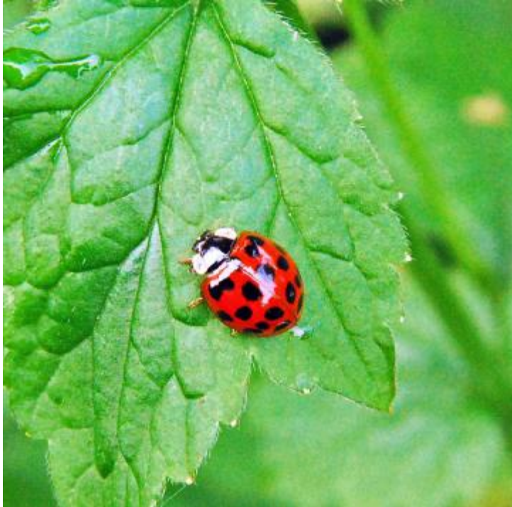
Abb. 1 Marienkäfer

Im April hatte ein Johannisbeerstrauch in meinem Garten gerade neue Blätter gebildet und wollte zu blühen anfangen. Aber er hatte sehr viele Blattläuse. Weil ihm die Blattläuse sehr viel Saft aus seinen neuen Blättchen saugten, ging es ihm schlecht und er jammerte: „Ach, wenn doch nur Marienkäfer kämen, mich von dieser Blattlausplage zu befreien“.